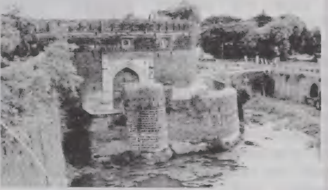
ಅಹಮ್ಮದ್ ನಗರದ ಕೋಟೆ

ಮದ್ದು ಗುಂಡು ಕಲ್ಲುಗಳಿಂದ ತುಂಬಿಸಿದ. ಚಾಂದ್ ಬೀಬಿಯ ಗುಪ್ತದಳದವರು ಅವನ್ನು ಪತ್ತೆಹಚ್ಚಿದರು. ಕತ್ತಲೆ ಆವರಿಸಿ ವೈರಿ ಸೈನಿಕರು ಬಿಡದಿಗೆ ಮರಳಿದಾಗ ಕೋಟೆಯ ಒಳಗಡೆಯಿಂದ ಎರಡು ಸ್ಥಳಗಳ ಸುರಂಗಗಳನ್ನು ಸದ್ದಿಲ್ಲದೆ ಖಾಲಿಮಾಡುವಂತೆ ಚಾಂದ್ ಬೀಬಿ ನಿಗಾವಹಿಸಿದಳು. ಒಂದಕ್ಕೊಂದು ಸಮೀಪವಿದ್ದ ಇನ್ನೂ ಮೂರು ಸುರಂಗಗಳನ್ನು ಖಾಲಿ ಮಾಡಬೇಕಾಗಿತ್ತು. ಅಷ್ಟರಲ್ಲಿ ಅದು ಶತ್ರುಗಳ ಗಮನಕ್ಕೆ ಬಂದು, ಮುರಾದನ ಆಜ್ಞೆಯಂತೆ ಮೂರು ಸುರಂಗಗಳನ್ನು ಏಕಕಾಲಕ್ಕೆ ಸ್ಫೋಟಿಸಲಾಯಿತು. ಭಯಂಕರ ಸದ್ದಿನೊಂದಿಗೆ ಅಹಮ್ಮದ್ ನಗರದ ಕೋಟೆ ಬಿರುಕುಬಿಟ್ಟಿತು. ಬಳಿಕ ಕಡು ಕತ್ತಲೆಯ ಘೋರ ಮೌನ! ಅಷ್ಟರಲ್ಲಿ ಚಿಲಕತ್ತು ಧರಿಸಿ ಕಠಾರಿ ಹಿಡಿದು ಕುದುರೆಯೇರಿ ಮುಖ ಮರೆಮಾಡಿದ ಸ್ತ್ರೀಯೋರ್ವಳು ಸೈನಿಕರನ್ನು ಹುರಿದುಂಬಿಸುತ್ತ ಬಿರುಕುಬಿಟ್ಟ ಸ್ಥಳವನ್ನು ತಲೆಪಿದ್ದಳು! ಕೋಟೆಯ ರಕ್ಷಣಾ ಗೋಡೆಯ ದುರಸ್ತಿ ಕಾರ್ಯ ಸದ್ದಿಲ್ಲದೆ ನಡೆಯಿತು. ಕಲ್ಲು ಮಣ್ಣುಗಳ ಜೊತೆಗೆ ಮರಣವನ್ನಪ್ಪಿದ ಸೈನಿಕರ ಹೆಣಗಳನ್ನೂ ಒಟ್ಟಿ ಗೋಡೆಕಟ್ಟಿ ಬಿರುಕು ಸರಿಪಡಿಸಲಾಯಿತು! ರಾತ್ರಿಯೆಲ್ಲ ಕುದುರೆಯಿಂದ ಇಳಿಯದೇ ಬಿರುಕು ಬಿಟ್ಟ ಸ್ಥಳದಿಂದ ಸರಿಯದೇ ಚಾಂದ್ ಬೀಬಿ, ದುರಸ್ತಿ ಕೆಲಸದತ್ತ ಗಮನ ಹರಿಸಿದಳು. ಗೋಡೆಯ ಕಂದಕದಾಚೆ ದೂರದ ಬಿಡದಿಯಲ್ಲಿ ದಣಿದ ಮೊಗಲ ಸೈನಿಕರನ್ನೆಲ್ಲ ನಿದ್ರೆ ಆವರಿಸಿತ್ತು.